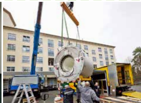
Einbau des neuen MRTs