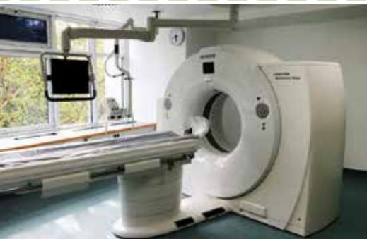
Einbau des neuen CTs