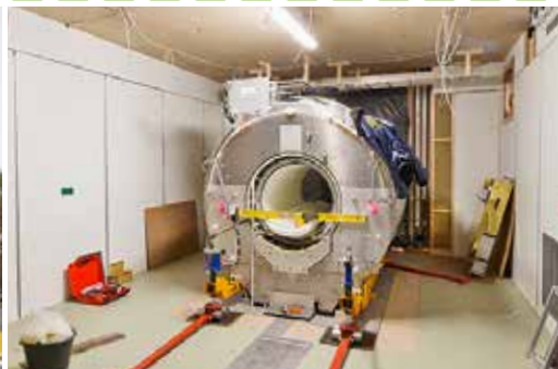
Einbau des neuen MRTs