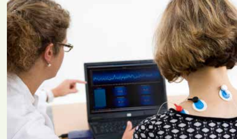
Biofeedback bei verschiedenen Schmerzarten