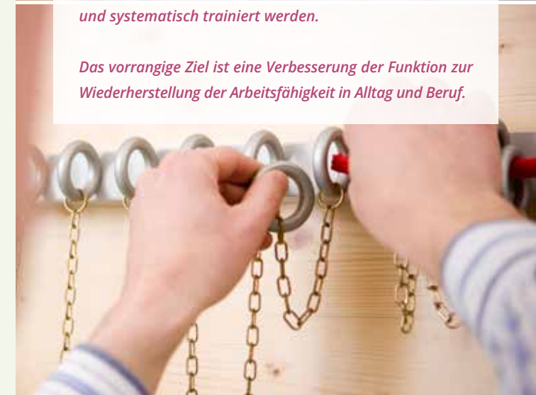
Das vorrangige Ziel ist eine Verbesserung der Funktion zur Wiederherstellung der Arbeitsfähigkeit in Alltag und Beruf.