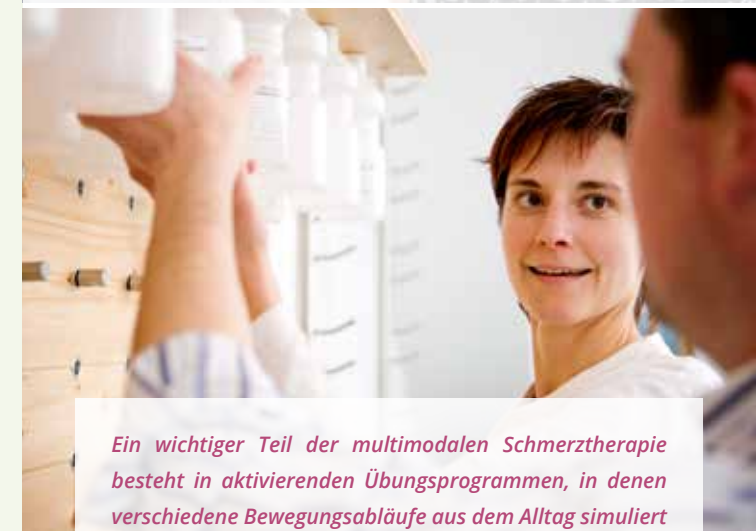
Ein wichtiger Teil der multimodalen Schmerztherapie besteht in aktivierenden Übungsprogrammen, in denen verschiedene Bewegungsabläufe aus dem Alltag simuliert und systematisch trainiert werden.