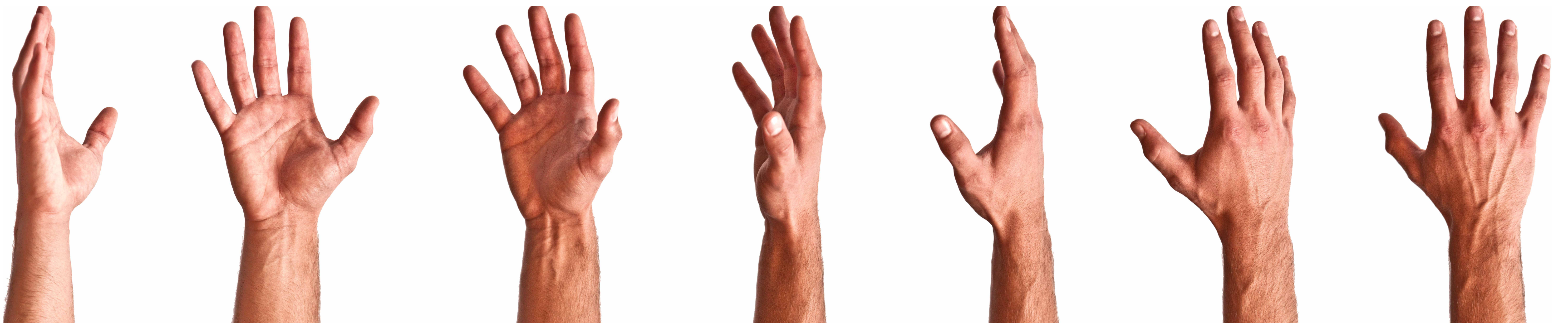
Das meistgebrauchte medizinische Instrument sind die Hände.