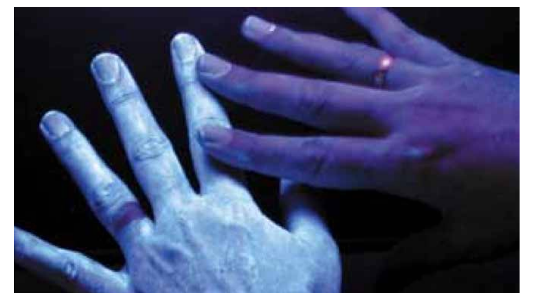
rechte Hand: ohne Desinfektion linke Hand: nach der Desinfektion (Ring verhindert die Benetzung der Haut)