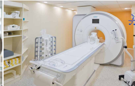
Neues MRT, Investition: 1,3 Mio. Euro