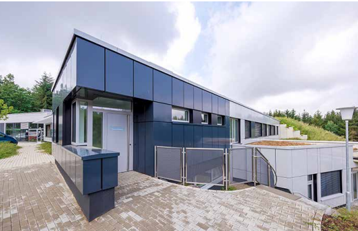
Radiopharmazie, Investition: 11,4 Mio. Euro