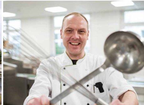
Moderne Küche, Investition: 4,1 Mio. Euro